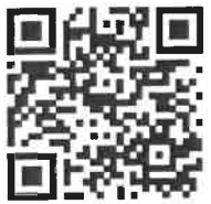
【保育士・幼稚園教諭①】