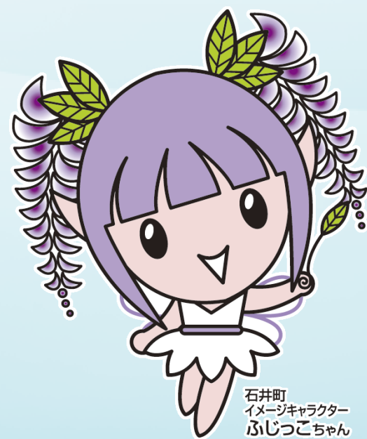
石井町 イメージキャラクター ふじっこちゃん