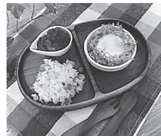
(※木製のお皿・フォーク・スプーンのセット)

また、町内の福祉サービス事業所に木製品の製造を委託し、就労支援等の活性化も図る。