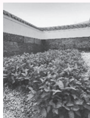
中央公民館内の 藍畑

この講座は、石井町の藍の歴史を学ぶことから始まり、土作り、苗植え、水やりといった葉藍づくり、自ら育てた生葉で叩き染めや葉藍を発酵させた「沈殿藍」（染料）で染色をするという体験講座です。