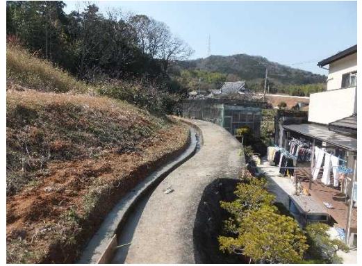
水路の補修工事をしています