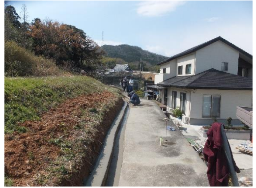
水路の補修工事をしています