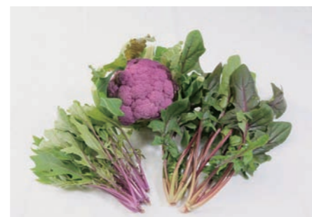
いいの藤やさい（紫色野菜）