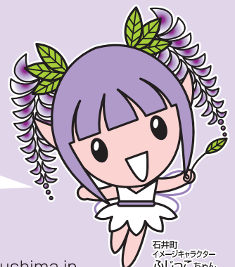
石井町 イメージキャラクター ふじっこちゃん