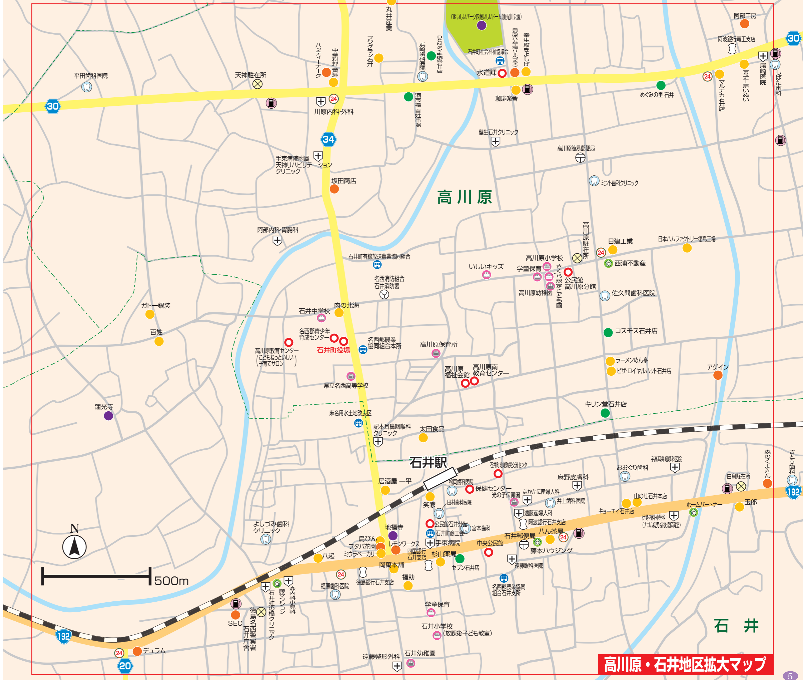
高川原・石井地区拡大マップ