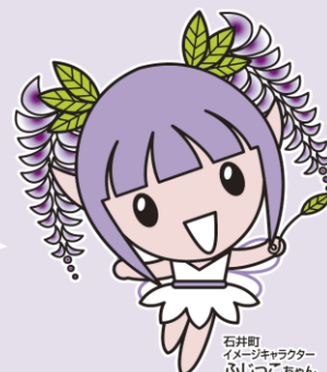
石井町 イメージキャラクター ふじつこちゃん