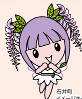
石井町 イメージキャラクター ふじっこちゃん

石井町からはお申込み確認連絡・入金確認連絡・ 記念品の発送連絡はいたしていません。