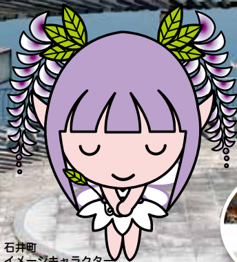
石井町 イメージキャラクター ふじっこちゃん