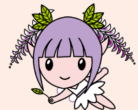
石井町 イメージキャラクター ふじっこちゃん

記念品は、寄附の納付が確認できてからお贈りします。 クレジット決済の場合、Yahoo! 公金支払いから代理納付が確認できてから発送となります。