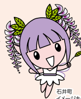
石井町 イメージキャラクター ふじっこちゃん