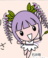
石井町 イメージキャラクター ふじっこちゃん