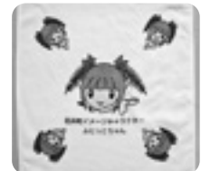
(今号のふじっこちゃんグッズ) フェイスタオル

ハガキに記入例のように答えを書いて、応募方法により 8月17日(月)役場必着でご応募ください。抽選で、「1,000円の図書カード」(5名)、または「ふじっこちゃんフェイスタオル」(5名)を進呈します。