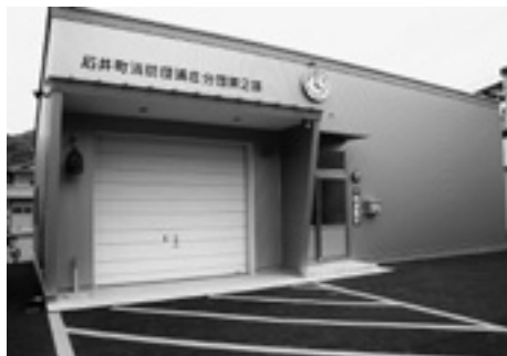
浦庄分団第2部詰所