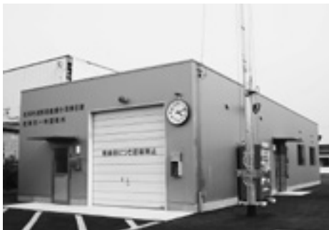
藍畑分団第6部詰所

◎受講を希望される方は、石井町教育委員会社会教育課 ☎674-7505または高川原福祉会館☎674-0403まで