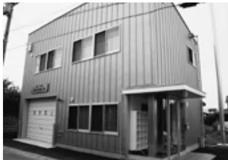
藍畑分団第5部詰所