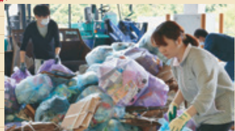
▲リサイクルセンターでの分別作業(6月3日~6月17日)

石井町の新人職員10名が、研修の一環としてリサイクルセンターで資源ゴミの分別などを行うなどして、日々の業務に励むとともに経験を積み重ねています。