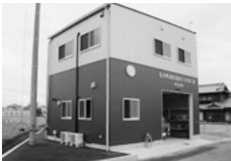
浦庄分団第3部詰所