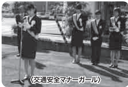
〈交通安全マナーガール〉

9月17日にフジグラン石井で、交通安全母の会等が参加し事前キャンペーン活動が行われ、9月27日には交通安全マナーガールによる事業所訪問が行われました。