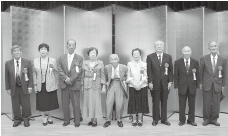
各代表として敬老会で表彰させていただいた皆さん 右から、米寿到達者・90歳到達者・夫婦そろって80歳到達者・夫婦そろって90歳到達者(ご主人様のみ出席)・金婚者・ダイヤモンド婚者

式典後は、各地区老人クラブ連合会の皆さん、石井合同舞踊の会の皆さんなどによるアトラクションで楽しい一日を過ごしていただきました。