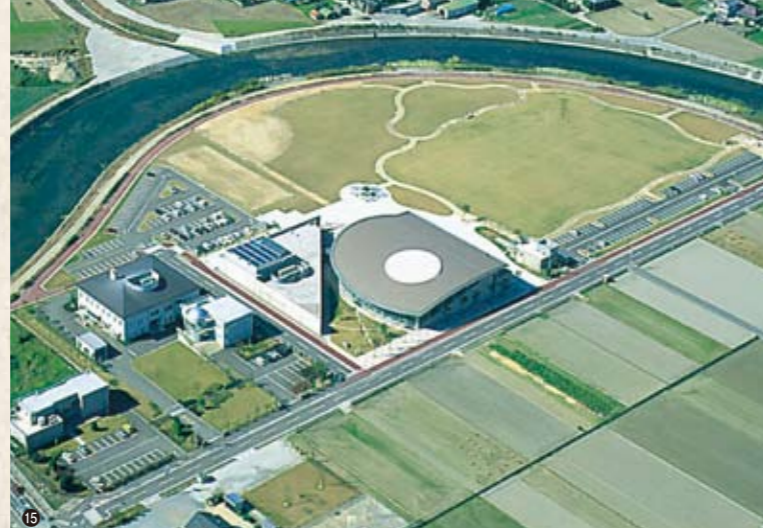
⑧ 町内初の信号機設置当時 ⑨ 阿波国分尼寺跡 ⑩ 上水道給水開始 ⑪ 田中家住宅 ⑫ 前山公園空撮 ⑬ 国体相撲会場 ⑭ 平成13年新童学寺トンネル開通式 ⑮ 飯尾川公園空撮