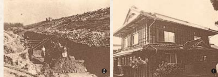
① 藍畑村役場 ② 吉野川堤防改修工事 ③ 吉野川改修工事の現況 ④ 天皇巡幸 ⑤ 藍畑中学校 ⑥ 藍畑村立和洋裁縫高等学校 ⑦ 通話を開始した高原有線電話